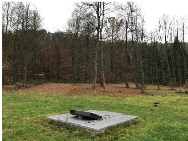
Von unten Blick auf das Waldstück