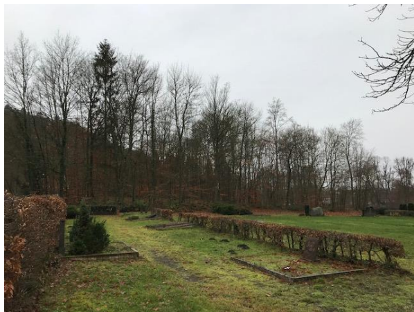
Von der rechten Seite auf dem Hauptfriedhof